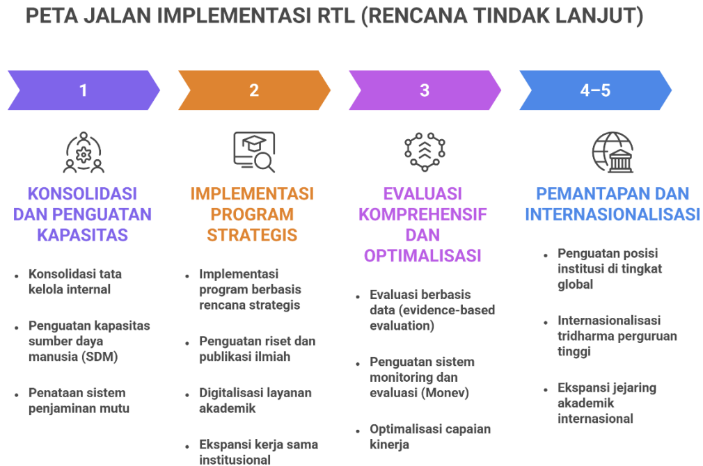
Gambar 2. Peta Jalan Implementasi RTL

Implementasi RTL dirancang dalam kerangka waktu bertahap untuk memastikan efektivitas dan keberlanjutan program.