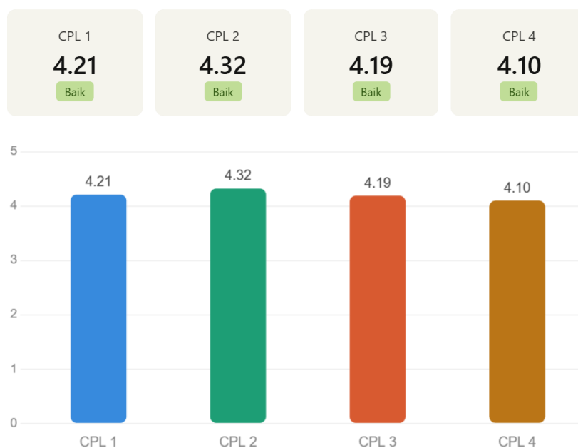
Grafik Capaian CPL Program Studi S2 Linguistik Terapan

Berdasarkan hasil exit survey yang dihimpun dan disusun menjadi grafik seperti di atas, maka dapat diperoleh hasil interpretasi hasil capaian CPL Prodi Linguistik Terapan. Secara keseluruhan, seluruh CPL menunjukkan capaian yang berada pada kategori Baik dengan rentang rerata skor antara 4,10 hingga 4,32 dari skala maksimal 5. Hal ini mengindikasikan bahwa lulusan menilai diri mereka telah memiliki kompetensi yang memadai di seluruh bidang yang dikembangkan oleh program studi.